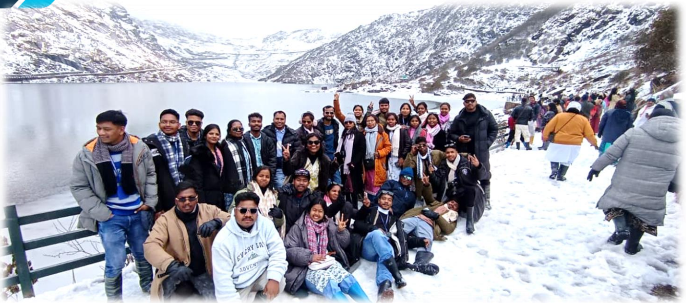
Educational Tour Experience

My experience of the educational tour was wonderful and full of excitement, especially because it was my first time going on such a trip. On 11/03/26 , we, the second-year students, started our journey from Hazaribag to Ranchi by bus. Everyone was filled with energy and excitement. The journey was both enjoyable and tiring at times. We sang, danced, and played games on the bus, making the journey lively and fun.