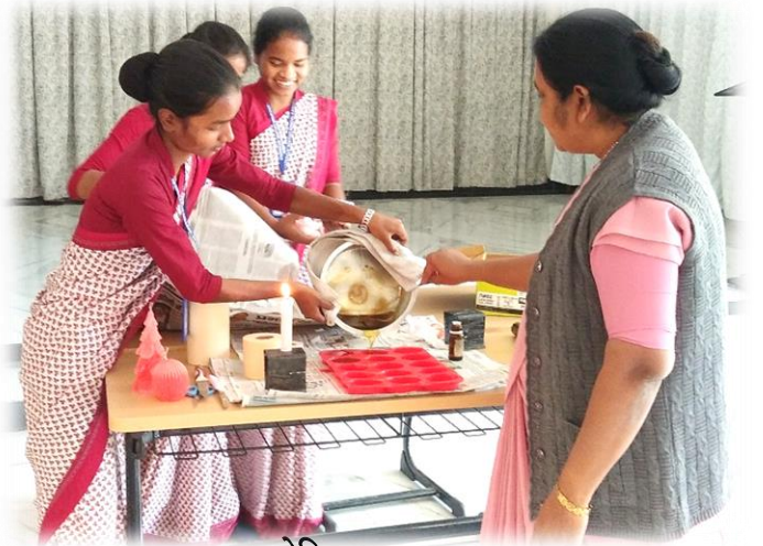
सेमिनार का अनुभव

तीन दिवसीय सेमिनार में भाग लेना मेरे लिए एक सुनहरा अवसर था। शुरू में मैं सोच रही थी कि पता नहीं मैं कुछ सीख पाऊँगी या नहीं, क्योंकि यह मेरा पहला सेमिनार था। लेकिन जैसे-जैसे दिन बीतते गए, मेरा अनुभव बहुत ही अच्छा और यादगार बनता गया।